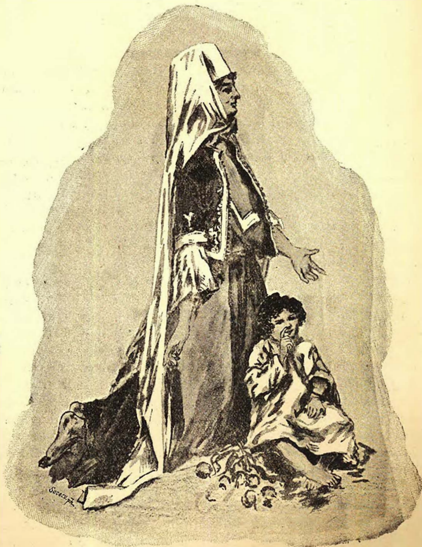
O Nazarîtencă cu fiul ei ingenunchiând la mormântul lui Isus

— Mergem, mergem, numai de cât, zise Gogu mașinalicește, care se învârtea prin odae cântând un vals lin și în fantazia-î liberă de student se încerca să deslușiască mâna cea de spumă ce a zărit-o adineori printre zabrele, chipul acela gingaș al fetei.